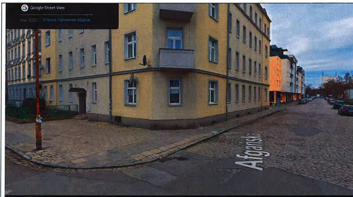
Fot. 5. Widok ze skrzyżowania z ulicą Birmańską na odcinek ulicy Afgańskiej, którym do zielonego skweru będzie przebiegać linia kablowa.

Na badanym odcinku nie stwierdzono drzew ani krzewów na które będzie oddziaływać inwestycja.