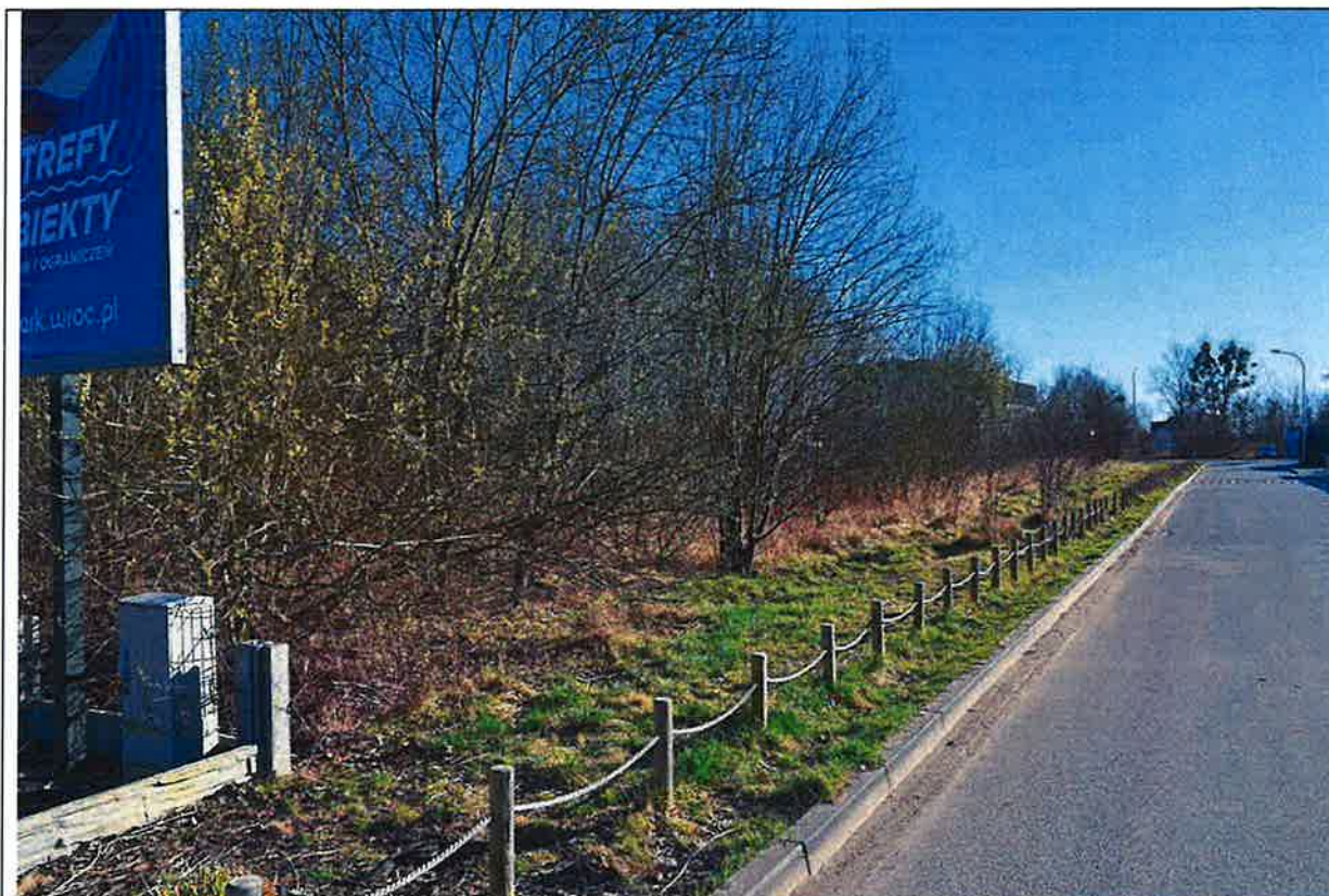
Fot. 12. Widok na wschodnią stronę pasa drogowego ulicy Polnej za Aquaparkiem Brochów z zielenią sukcesji wtórnej (numery TBS.2025/2.60 - TBS.2025/2.63): wierzby oraz skupina samosiewów robinii akacjowej.