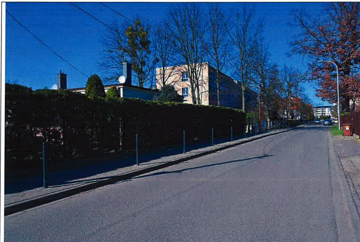
Fot. 10. Widok na formowany żywopłot o numerze inwentaryzacyjnym TBS.2025/2.52 rosnący wzdłuż ogrodzenia posesji Polna nr 6, prace przy nim należy prowadzić ręcznie przy użyciu Air Spade. W głębi zdjęcia po prawej stronie drogi widoczne najcenniejsze drzewo – dąb szypułkowy, o numerze inwentaryzacyjnym TBS.2025/2.52, rosnący na posesji Polna nr 7, w strefie którego prace należy wykonać metodą przewiertu sterowanego na głębokości 1,3 metra.

Kolejna grupa drzew przy których przebiega linia kablowa znajduje się przy terenie Aquaparku Brochów i jego parkingów (numery TBS.2025/2.53 - TBS.2025/2.58). Są to w przeważającej większości starsze egzemplarze drzew, przy których wykonano nowe nawierzchnie utwardzone i na podstawie oględzin oraz analizy ortofotomap i zdjęć dostępnych w usłudze Google Street View widać ich stale pogarszający się stan fitosanitarny, który należy monitorować i regularnie pielęgnować te drzewa. Przy terenie Aquaparku, po trasie projektowanej linii kablowej znajduje się również jedna skupina nasadzeń krzewów z gatunku pęcherznica kalinolistna (numer inwentaryzacyjny TBS.2025/2.59).