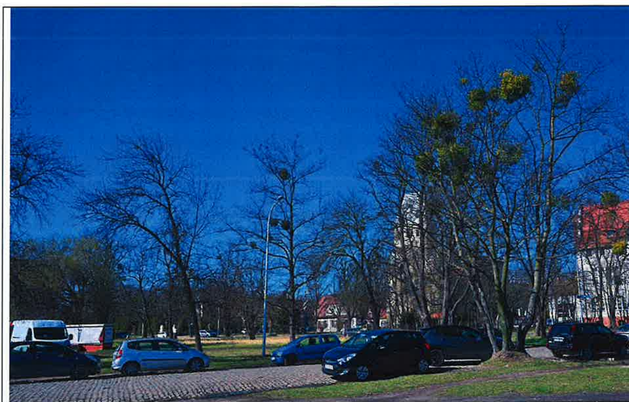
Fot. 1. Widok na pas drogowy ulicy Pakistańskiej z działki, do której ma być doprowadzone zasilanie awaryjne, po prawej stronie zdjęcia na pierwszym planie dwa wielopniowe klony rosnące na gruzowym wyniesieniu gruntu, posiadające zezwolenie na usunięcie o numerach inwentaryzacyjnych TBS.2025/2.1, TBS.2025/2.2, po przeciwnej stronie drzewa o numerach TBS.2025/2.3, TBS.2025/2.4, TBS.2025/2.5 pod którymi linia kablowa będzie położona przewiertem sterowanym.

Pozostałe 5 drzew opisanych w ramach tego opracowania o numerach TBS.2025/2.3 - TBS.2025/2.7 rośnie po południowej stronie pasa drogowego ulicy Pakistańskiej, z czego jedno z drzew gatunku robinia akacjowa (dwupniowa) było już opisane w opracowaniu TBS.2022/4 pod numerem TBS.2022/4.29 a w obecnym jest pod numerem TBS.2025/2.3. Drzewo to jest w złym stanie fitosanitarnym i należy o tym powiadomić zarządcę drogi by podjął działania poprawiające jego stan lub zdecydował się na jego usunięcie. Zaproponowany sposób położenia przeciskiem linii kablowej w strefie SOD tego drzewa nie wpłynie negatywnie na jego obecny stan fitosanitarny, jednakże, jeśli