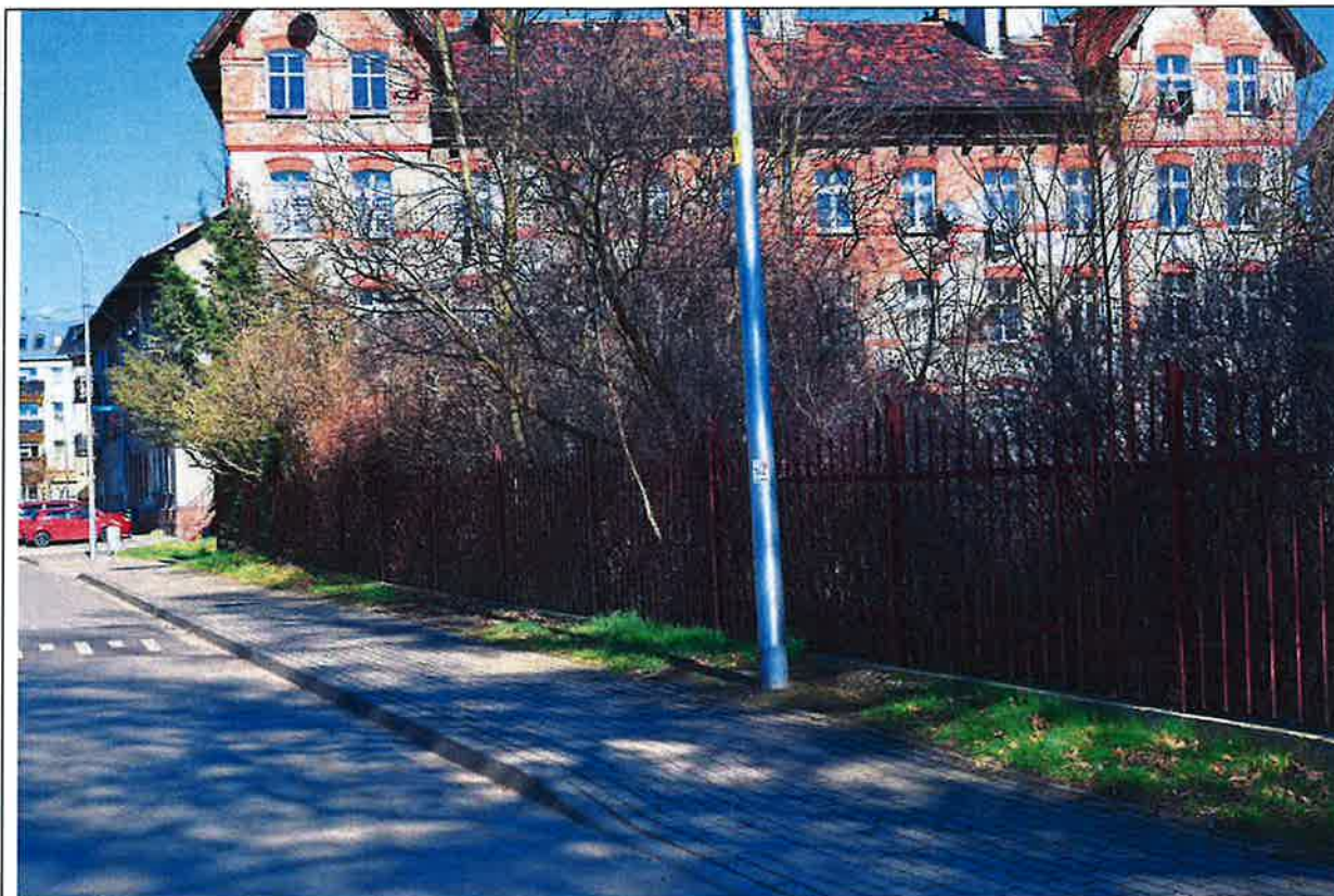
Fot. 9. Widok na drzewa i krzewy rosnące wzdłuż ogrodzenia posesji Polna nr 7 z przewieszającymi się koronami nad ogrodzeniem i chodnikiem. Sieć kablowa na tym odcinku zostanie położona metodą przewiertu sterowanego na głębokości 1,3 metra.

Podążając dalej przebiegiem projektowanej sieci, sprawdzano lokalizacje drzew z podkładu mapowego i wobec stwierdzenia braków drzew w terenie (najczęściej na prywatnych posesjach) lub nieprecyzyjnego ich usytuowania na mapie dokonano stosownych pomiarów i naniesiono to na mapę z przebiegiem sieci. Jednocześnie nanosząc na mapę powierzchnie krzewiaste na które może oddziaływać inwestycja.