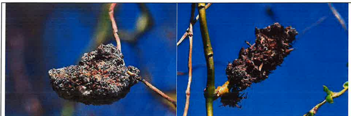
Fot. 3. Zniekształcone pędy wierzby mandżurskiej przez Eriophyes triradiatus.