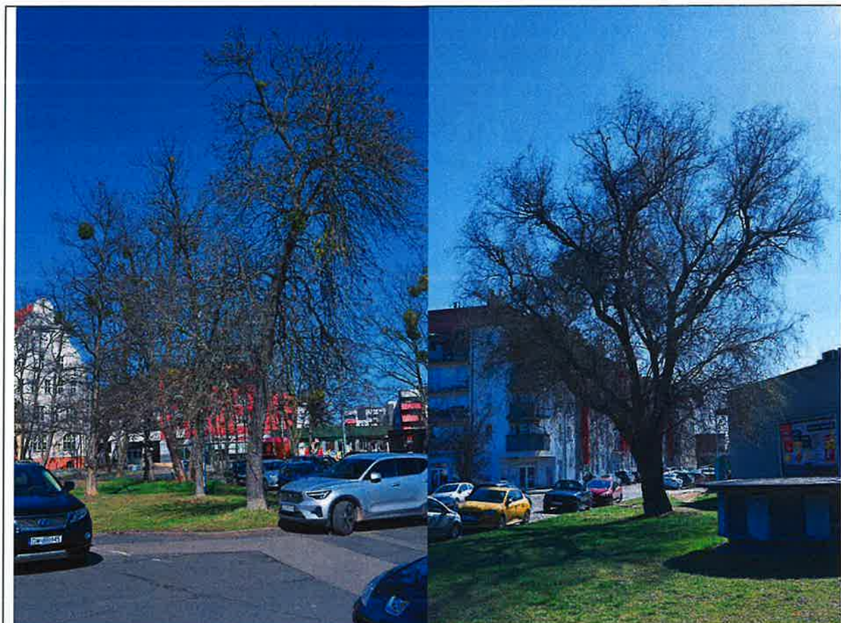
Fot. 2. Widok na południową stronę pasa drogowego ulicy Pakistańskiej. Na zdjęciu po lewej, widok z parkingu przy sklepie „Biedronka” na pierwszym planie jesion pensylwański o numerze inwentaryzacyjnym TBS.2025/2.6. Na zdjęciu po prawej stronie widok na wierzbę mandżurską w odmianie Tortuosa o numerze inwentaryzacyjnym TBS.2025/2.7. Pod strefami SOD drzew ze zdjęć będzie ułożona linia kablowa metodą bezrozkopową - przewiertem sterowanym.

drzewo zostanie usunięte przez zarządcę drogi przed rozpoczęciem prac ziemnych nie będzie konieczności stosowania przewiertu sterowanego na odcinku, gdzie jest jego strefa SOD. Pozostałe drzewa posadzone w różnej odległości od skrajni drogi stanowią zielen przyuliczną i są w dobrym stanie fitosanitarnym.