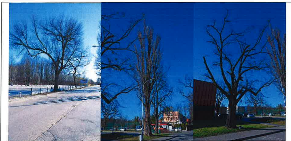
Fot. 11. Widok na ulicę Polną przy Aquaparku Brochów. Na zdjęciu po lewej na pierwszym planie jesion pensylwański o numerze inwentaryzacyjnym TBS.2025/2.54. Na zdjęciu po środku topola czarna w odmianie Italica (TBS.2025/2.57) a za nią kasztanowiec biały (TBS.2025/2.56). Na zdjęciu po prawej stronie widok lipę drobnolistną o numerze inwentaryzacyjnym TBS.2025/2.58. Pod strefami SOD drzew ze zdjęć będzie ułożona linia kablowa metodą bezrozkopową - przewiertem sterowanym na głębokości minimum 1,3 metra..

Pozostała zinwentaryzowana zieleń (numery TBS.2025/2.60 - TBS.2025/2.63) na którą składają się wierzby i robinie akacjowe rośnie za parkingiem Aquaparku po stronie wschodniej ulicy Polnej i z analizy ortofotomap oraz zdjęć dostępnych w usłudze Google Street View wynika, że jest to zieleń sukcesji wtórnej, która wyrosła po roku 2015.