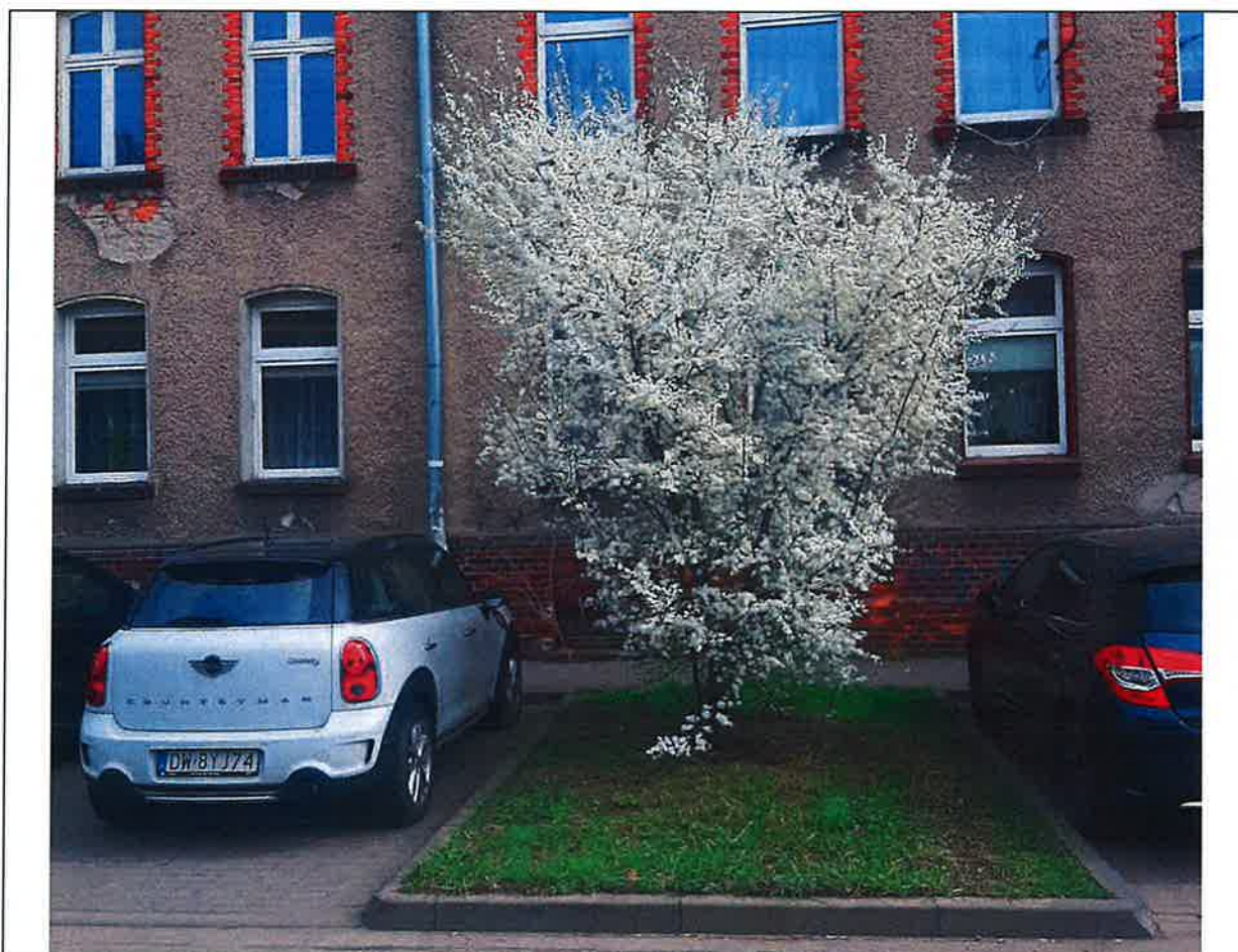
Fot. 8. Śliwa tarnina na skwerze zielonym między miejscami parkingowymi

Następnym miejscem, gdzie znajduje się duże zagęszczenie drzew i krzewów (numery inwentaryzacyjne TBS.2025/2.32 - TBS.2025/2.50) to jest teren posesji Polna nr 7, wzdłuż ogrodzenia osłonowo są posadzone lilaki pospolite (część starszych egzemplarzy jest w formie drzew), cyprysiki Lawsona, forsycja pośrednia, tamaryszek drobnokwiatowy (w formie drzewa), śnieguliczki białe, lilak chiński, laurowiśnię wschodnie. Wyróżnić wzdłuż ogrodzenia możemy też wyższe egzemplarze drzew z gatunków rodzimych: klon jawor, jesion wyniosły oraz najcenniejsze drzewo (numer inwentaryzacyjny TBS.2025/2.49) na obszarze opracowania, którym jest dąb szypułkowy o obwodzie pnia 318 cm.