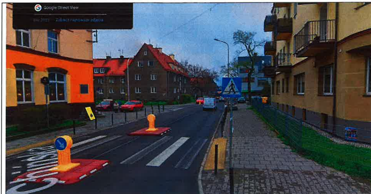
Fot. 7. Widok ze skrzyżowania z ulicą Birmańską na odcinek ulicy Chińskiej, którym do skrzyżowania z ulicą Polną będzie przebiegać linia kablowa. (źródło Google Street View opracowanie graficzne Aleksander Lorenz)